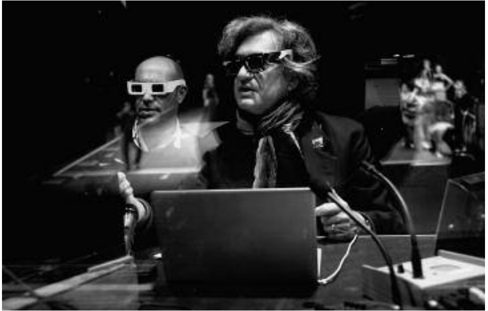
Wim Wenders bei den Dreharbeiten zu PINA

Die momentan noch andauernde 3D-Filmwelle, die in schöner Regelmäßigkeit alle 25 Jahre die Kinos erfasst, hat inzwischen auch Filme namhafter Filmautoren hervorgebracht, die die Technik auf ganz eigene Weise nutzen: Während Werner Herzog die Technik nur in seinem Film CAVE OF FORGOTTEN DREAMS einmal ausprobierte, tüftelt Wim Wenders inzwischen schon seit zwei Jahren an der Beherrschung der neuen Technik, die einer Meinung nach das Kino revolutionieren wird. Beide Filme stehen im Mittelpunkt des diesjährigen 3D-Filmfestes, das jeweils um 18.30 Uhr ungewöhnliche neue Produktionen in digitaler 3D-Projektion vorstellt und um 21.00 Uhr klassische 3D-Produktionen aus dem Hollywood der 1950er Jahre in zweistreifiger 35mm-Vorführung mit Pause präsentiert. Dabei wird das vom Academy Film Archive in Hollywood restaurierte Musical THOSE REDHEADS FROM SEATTLE seine deutsche Erstaufführung erleben. Stefan Drößler wird mit einer aktualisierten Version seines Vortrags über die Geschichte des 3D-Films das Filmfest eröffnen. Für alle Vorstellungen werden zirkulare Polarisationsbrillen von RealD benötigt, die an der Kinokasse erhältlich sind.